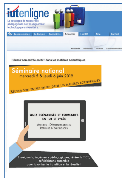
Le site IUTenligne, lancé en 2001.