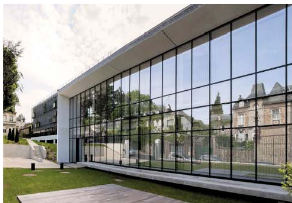
Le centre de ressources, 6 rue de Biborel