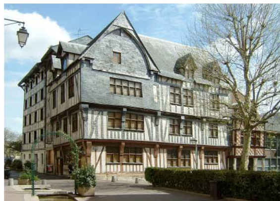
Le centre d'expositions, Maison des Quatre Fils Aymon, 185 rue Eau-de-Robec

Aujourd'hui implanté à Rouen, le Musée national de l'Éducation, service du CNDP, est l'héritier lointain mais direct du Musée pédagogique de l'État, créé à Paris par Jules Ferry en 1879. Le MNE s'attache à recueillir les traces matérielles et les représentations relatives à l'éducation scolaire, périscolaire et familiale. Ses collections comportent à ce titre des peintures, des estampes et de l'imagerie populaire (20 000 pièces), des archives photographiques (395 000 clichés), des documents liés à la pédagogie audiovisuelle : vues sur verre, films fixes, disques, films animés, etc. (220 000 items), une collection de livres scolaires, d'ouvrages de pédagogie et de littérature pour la jeunesse (110 000 volumes), des périodiques (38 000 volumes) du matériel pédagogique et du mobilier scolaire (25 000 pièces), des travaux d'élèves (81 500), des jeux et des jouets (4 000) ainsi qu'un fonds de 7 000 « documents autographes » émanant d'institutions ou de personnages notoires, soit au total, plus de 950 000 objets et documents. Par leur ampleur et leur diversité, ces fonds constituent la plus importante collection de patrimoine éducatif en Europe ( http://www.cndp.fr/musee ).