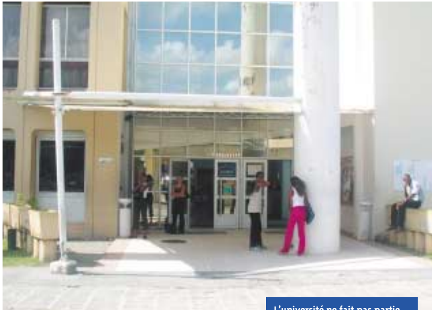
L'université ne fait pas partie du paradis antillais...

Les effets de la politique ministérielle risquent de marginaliser encore davantage une université déjà soumise à des handicaps sociaux et territoriaux.