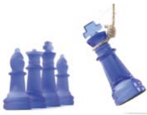
Dix collègues évincés du jury !

▼ La communauté universitaire éprouve un sentiment de consternation ▲